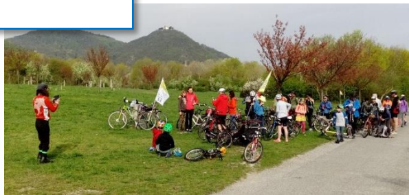
Anreise zur Radparade 2018, Fotohalt auf der Donauinsel

Um 10 Uhr treffen wir in Floridsdorf im Cafe Jonas (Franz-Jonas-Platz 11) ein, wo Zeit zum Einkehren und zur Stärkung bleibt. Die Weiterfahrt erfolgt um 11 Uhr, unterwegs kommen am Gaußplatz RadlerInnen aus der Brigittenau hinzu. Die Radparade selbst startet um 12 Uhr vor dem Burgtheater.