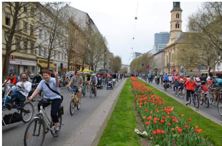
Radparade 2018: die autofreie Praterstraße lädt zum gemütlichen Radeln ein

Ab Floridsdorf werden wir von der Polizei begleitet. Das verkürzt uns den Weg und erlaubt uns das Benützen der Fahrbahnen. Gleichzeitig bietet es Familien die Möglichkeit, mit ihren Kindern entspannter zu radeln. Prinzipiell gilt jedoch, dass selbstverständlich jede/r für sich selbst verantwortlich ist!