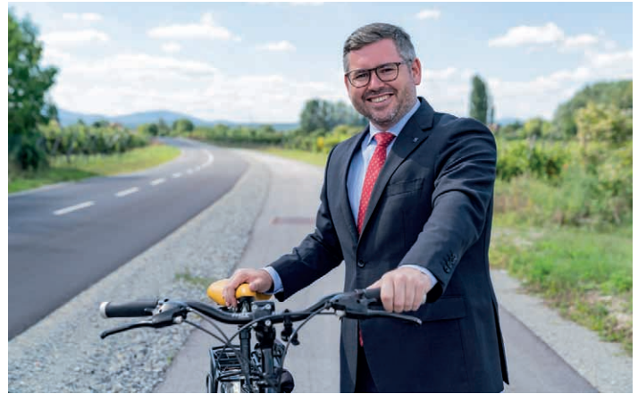
NÖ Mobilitätslandesrat Ludwig Schleritzko