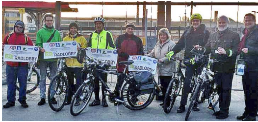
Bild von der Radsaisonöffnung 2014

Nachdem am 31. Dezember 2014 die aktuelle Radsaison endet, lädt die Radlobby Korneuburg wieder zur Eröffnung der Radsaison in Niederösterreich: 1. Jänner 2015 Treffpunkt & Zeit findest Du ab 10. Dezember auf noe.radlobby.at