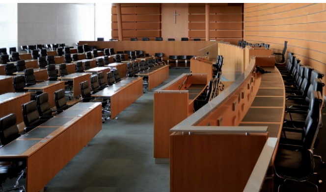
Sitzungssaal des NÖ Landtages