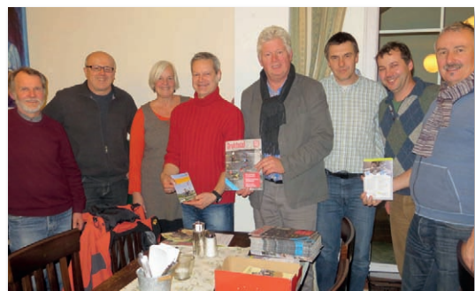
Bild von der aktuellsten Gründung: Radlobby Wolkersdorf im Weinviertel