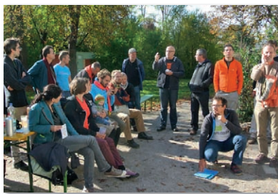
Bild vom ersten österreichweiten Radlobby Workshop in St.Pölten. Aktive Radlobby-Mitglieder aller Vereine tauschen Erfahrungen und Ideen für unser gemeinsames Engagement aus